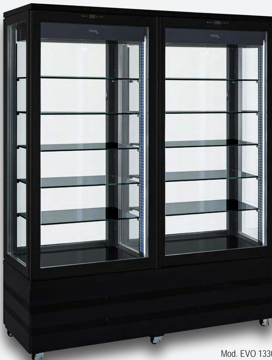
Mod. EVO 1330